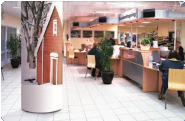
Det finns alltid utrymme för Pop Up Tower.

Pop Up Tower är perfekt som en fristående och flexibel pelare med budskap i exempelvis en reception eller som ett effektivt komplement i en monter. Skapar stor effekt på liten golvyta!