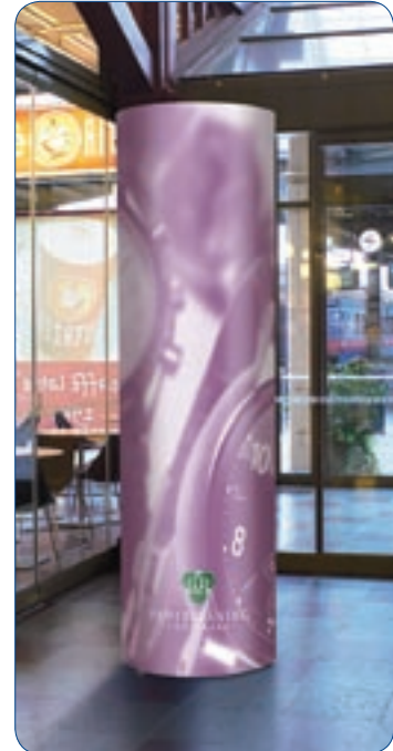
Lek med den runda formen och presentera ditt budskap på ett spännande sätt.