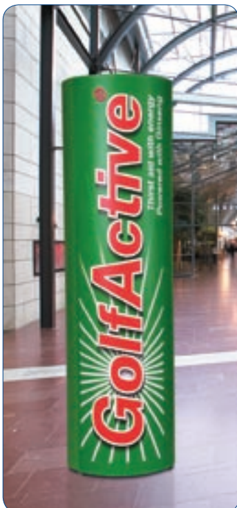
Står stadigt och monteras enkelt upp i de mest skilda miljöer.