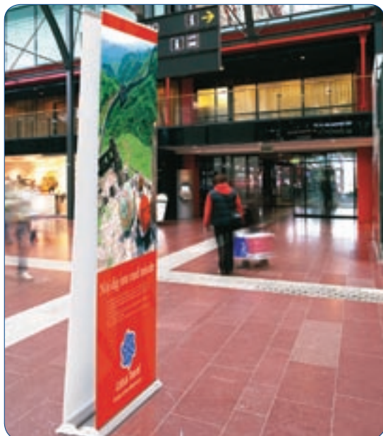
Roll Up Professional è disponibile anche in versione bifacciale.