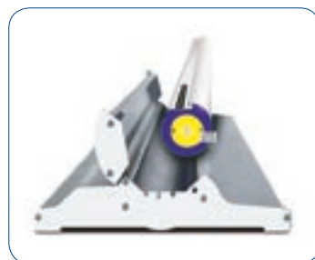
La stampa è perfettamente protetta durante il trasporto.