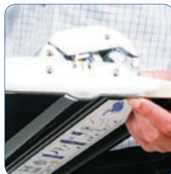
Roll Up Professional consente di sostituire la stampa rapidamente premendo un pulsante.