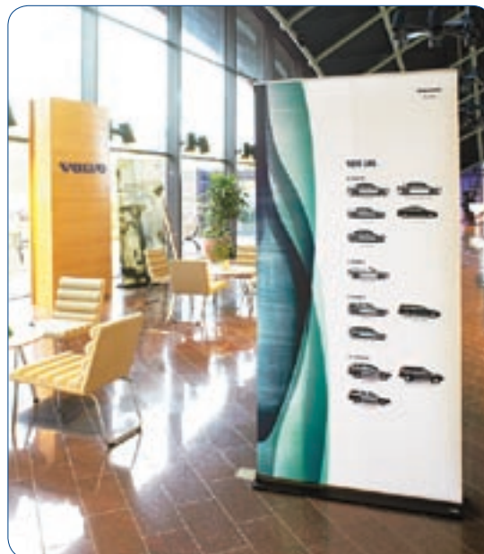
Roll Up Classic è disponibile in 4 combinazioni di larghezza e altezza.