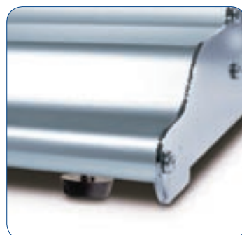
Design robusto per la massima stabilità su qualsiasi superficie.