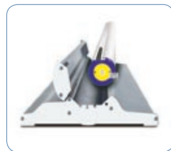
Les visuels sont bien protégés pendant le transport