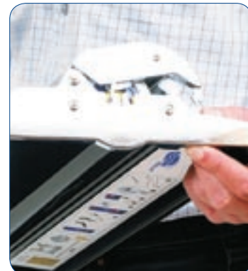
Avec Roll Up Professional, il suffit d'appuyer sur un bouton pour changer de visuel.