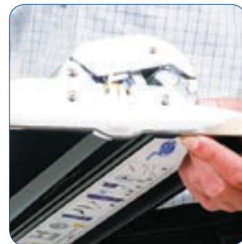
Para cambiar la imagen en Roll Up Professional, basta con pulsar un botón.