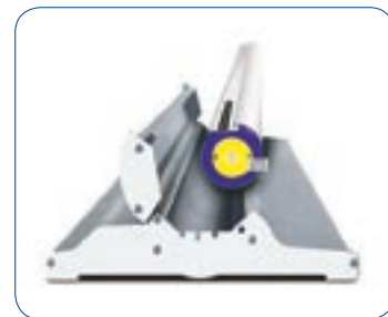
La imagen va bien protegida durante el transporte.