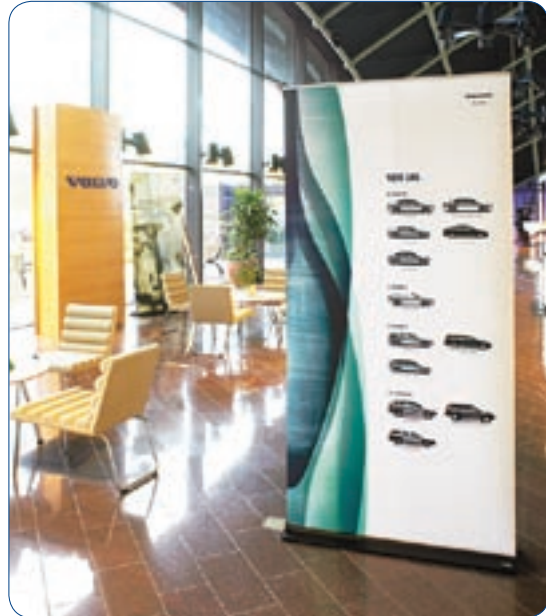
El Roll Up Classic, dispone de cuatro opciones de anchura y altura.