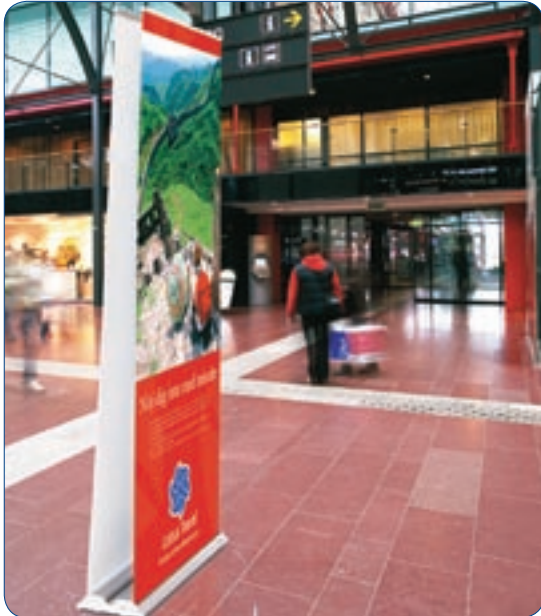
Roll Up Professional está también disponible en versión de doble cara.