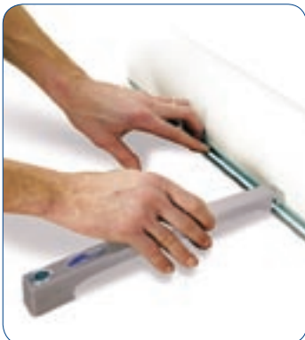
Diseño bien pensado hasta el último detalle. Enganche el pie en la parte inferior.

4 Screen puede que sea el sistema de mejor relación costo/beneficio para presentar su mensaje en una gran área de imagen y llamar la atención al máximo. Perfecto para eventos y grandes campañas, donde todo tiene importancia, desde el precio hasta el tiempo necesario para presentar el mensaje. Con un diseño simple y discreto, se monta en menos de un minuto. A pesar de su bajo peso, tan sólo 2 kilos, 4 Screen se mantiene firme y estable.