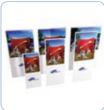
Is verkrijgbaar in zes verschillende maten.