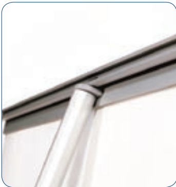
En de staander boven. Klaar!